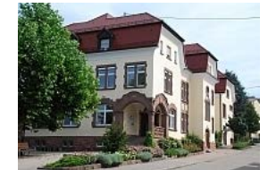
Von-Berckholtz Grundschule Ortenberg