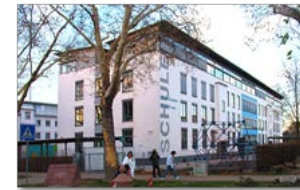
Anne-Frank Grundschule Offenburg